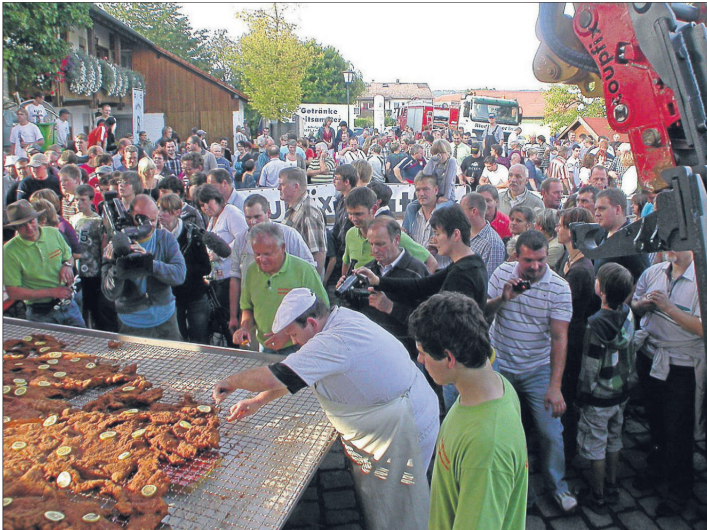
Rund 500 Zaungäste verfolgten den Rekordversuch und ließen sich dann ein Stück vom Riesenschnitzel schmecken.

Am heutigen Montag um 20 Uhr Volkstanz-Übungsabend im Gasthaus „Zum Alten Wirt“.